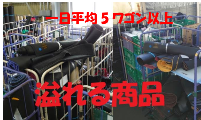
この大量の商品を整理して下さる倉庫さん、ダスキン大阪中央工場の方々に大変感謝です。

4月7日に発令されました『緊急事態宣言』 シャトル大阪中央店も非常に大きな影響を受けています。 シャトルは事業所専門のレンタル代行になっていますので大型商業施設が主のルートが多数存在します。梅田周辺、難波周辺、天王寺周辺などの大型商業施設の営業自粛、入っている多数の飲食店やアパレル関係のお店の営業はもろんのこと、その周辺のお客様も自粛することで、ほとんどレンタル処理が出来ないで帰ってくる担当者も多数発生しております。 もちろん郊外でも学校関連の休校や、パチンコ店、大型商業施設、レジャー関連のお客様など多種多様のお客様で休業状態が発生しています。担当者が訪問し休業の張り紙を確認し、ストップの情報を加盟店様に送らせていただいている分は普段の 5倍以上 。 お客様より休業のご連絡があり、加盟店様からシャトルに送られてくるストップ等の情報カードの枚数は、この1カ月だけで、なんと 5,000枚以上 。大阪の業務担当は3人ですけど・・・(泣)