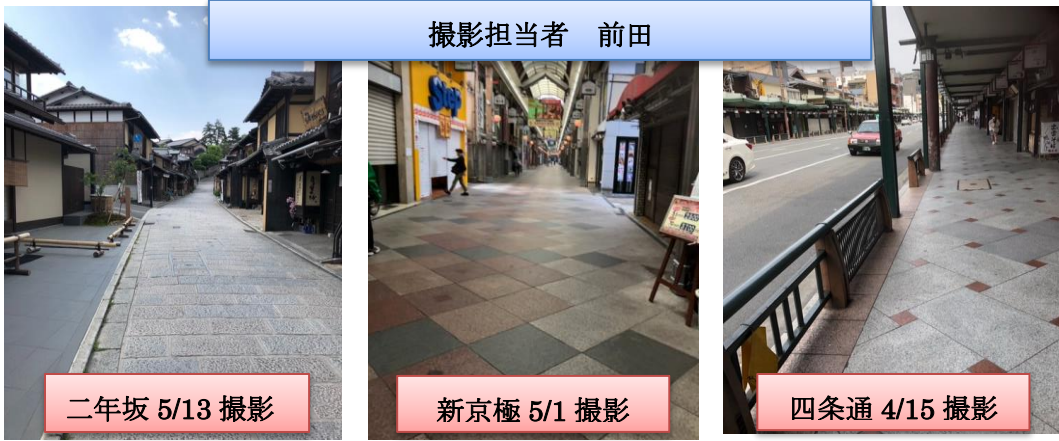
4月6日から4月30日までの4週間と前回レンタル時との比較

京都中央店の4月のストップ金額は約150万円。前期比較で約4倍。レンタル率は92.5%。前期は99.0%でした。大阪、神戸に比べると少なめですがそれでも大きな影響が出ています。