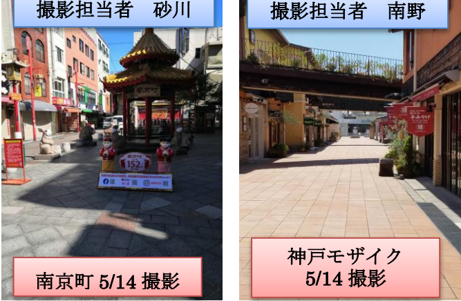
4月6日から4月30日までの4週間と前回レンタル時との比較