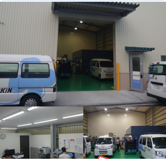
大阪北店の外観・内観・事務所です

大阪市淀川区十八条に『シャトル大阪北店』をオープンする事になりました。大阪中央店(都島区)では倉庫スペース、駐車スペースが共に限界。その為、大口の新規導入依頼のお話をいただきました。また日々の積込み業務にもかなりの影響もあり、帰社後の入庫、積込みも18時以降は 8~10台 くらいの待ち。待機時間は1時間超とスタッフにはかなりの負担がかかっていました。分店した事でスペースにゆとりが出来て大阪中央店での時間短縮もすこし見えるようになってきました。北店の状況と致しましては現在、地域は淀川以北、スタッフは7名、基礎売上は約2千万円。オペレーションは大阪中央店から繋げて対応しております。今後の展開として神戸中央店の管轄であります尼崎、川西方面も北店への移行も考えております。『よりお客様に近い立地に対応する事で、今まで以上にサービスの時間を取る』をスローガンとしてこれからも取り組んでいきます。